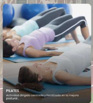
PILATES Actividad dirigida centrada y focalizada en la mejora postural...