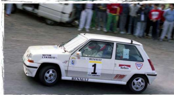
1989 / José del Pino - Agustín Asensio Renault 5 GT Turbo