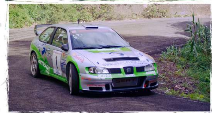
2002 / Flavio Alonso - Vidal Arencibia SEAT Córdoba WRC