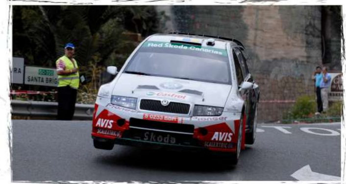
2008 / Antonio Ponce - Víctor Parada Skoda Fabia WRC