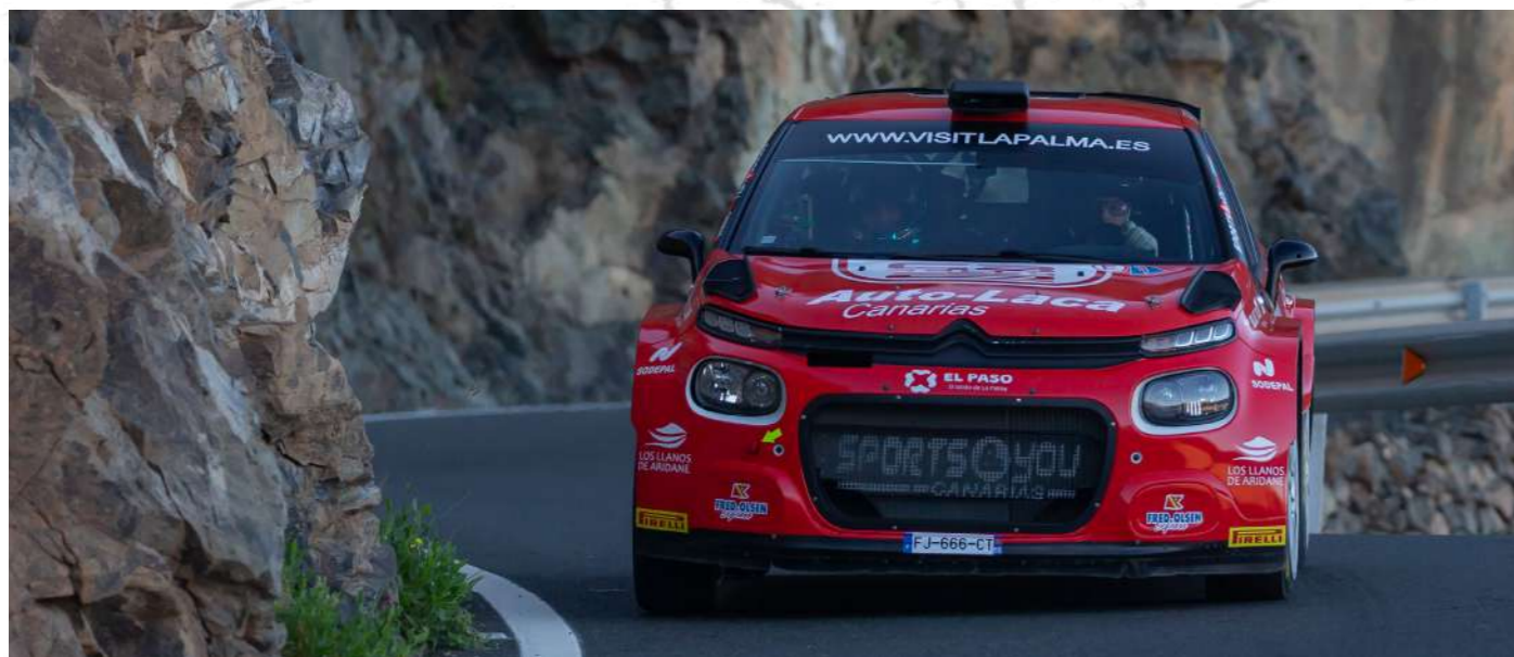
Campeonato de Canarias de Rallyes de Asfalto / Campeonato Bp de Rallyes de Las Palmas | 2024