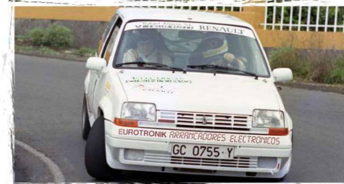
1994 / Sergio Marrero - Manuel Déniz Renault 5 GT Turbo (Open)