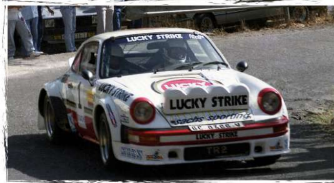
1985 / Medardo Pérez - Fleming Morgan Porsche 911 SC