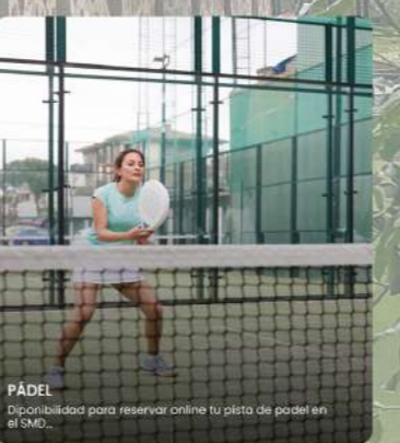
PÁDEL Disponibilidad para reservar online tu pista de pádel en el SMD...