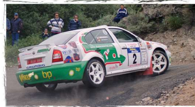
2003 / Antonio Ponce - Rubén González Skoda Octavia kit Car