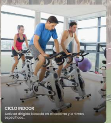
CICLO INDOOR Actividad dirigida basada en el ciclismo y a ritmos específicos...