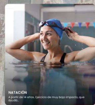
NATACIÓN A partir de 14 años. Ejercicio de muy bajo impacto, que ayuda...

Sociedad Municipal de Deportes de Santa Brígida S.L.