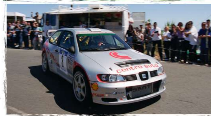
2001 / Flavio Alonso - Vidal Arencibia SEAT Córdoba WRC