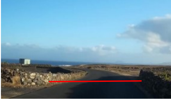
SALIDA: calle El Cuchillo (finca El Jable)