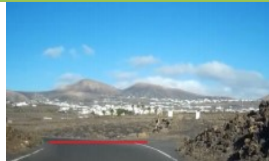
META: camino del cercado