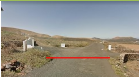
SALIDA: final calle Timanfaya (finca)