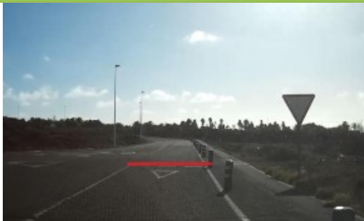
SALIDA: rotondas Tías (farola)