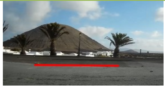
META: Parking Nuestra Sra de Los Dolores