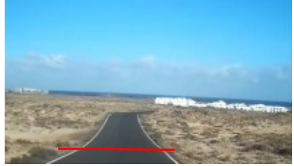
META: calle Hermanos Pinzones (explanada)