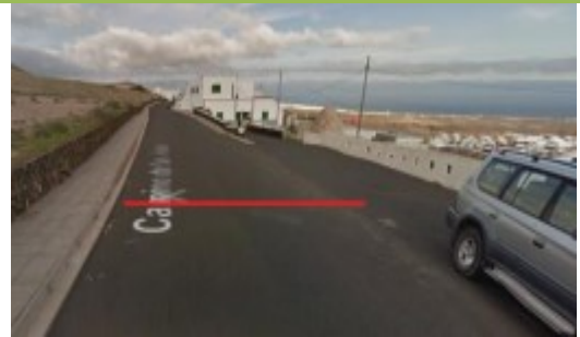
META: zona Iglesia La Candelaria (Tías)