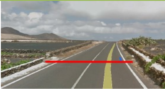
SALIDA: calle La Laguneta