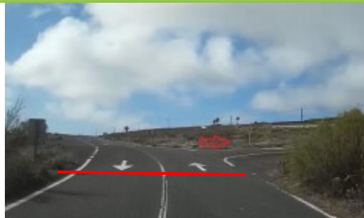
SALIDA: LZ10 zona Mirador Los Helechos (disco)